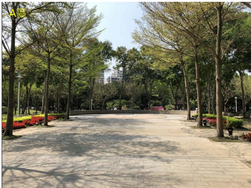
興隆公園圓形廣場